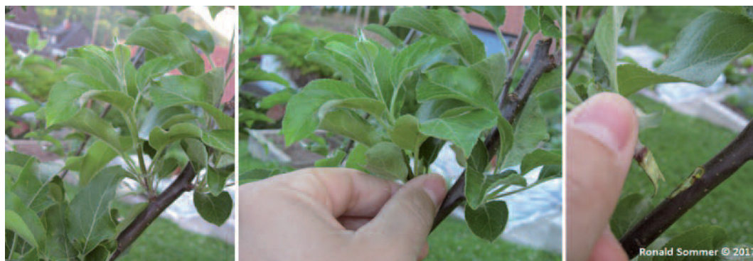
Abb. 2: Krautiger (nicht verholzter!) Trieb einer Birne im Juni.

Wer im Winter durch zu starken Schnitt zu starkes Wachstum angeregt hat, der wird von so genannten Wasserschossen („Wassertriebe“) heimgesucht. Wasserschosse wachsen gerne an der Oberseite eines Astes senkrecht in den Himmel, oftmals mit einer Länge über einen Meter. Diese Triebe sind für die Obstbaumnutzung wertlos, da sie dem Baum nur unnötige Kraft zum Ausreifen des Holzes rauben. Warum bis zum Sommerschnitt warten, wenn man sie im Juni mühelos mit einem Riss entfernen kann?