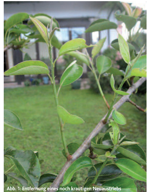
Abb. 1: Entfernung eines noch krautigen Neuaustriebs

Wenn ein Apfelbaum beispielsweise in einem Jahr 100 cm Trieblänge erreicht, wachsen die ersten 90 cm davon in der Zeit von April bis Ende Juni. Die restlichen 10 cm wachsen nach einer kurzen Pause von Juli bis in den September hinein (Triebabschluss, Terminalknospe). D.h. 90% des Längenwachstums sind um den 20.–22. Juni (Sommer Sonnenwende, Johannistag 24. 6.) abgeschlossen. Gleichzeitig sind diese Triebe zu diesem Zeitpunkt noch unverholzt krautig! Des Weiteren kann sich der Baum aufgrund der Jahreszeit (Sommer) und der vollständig entwickelten Blattmasse selbst sehr gut versor-